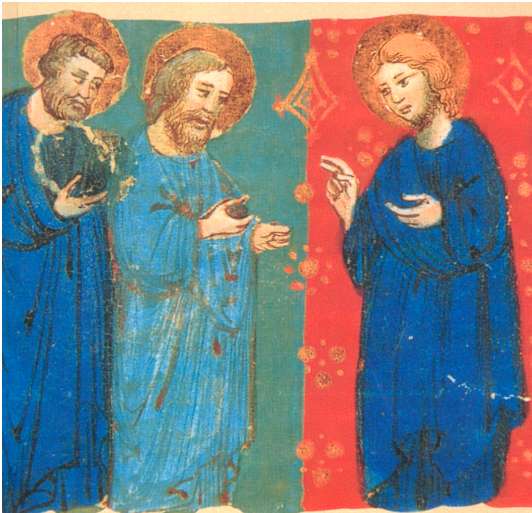
Rama de Familias Movimiento Apostólico de Schoenstatt